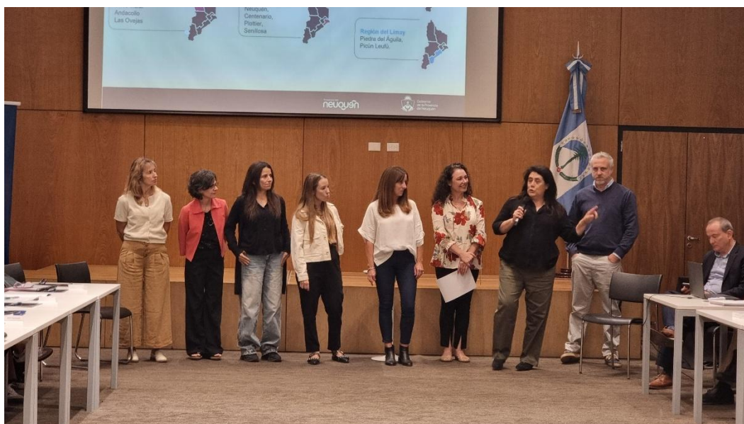
Equipo de la Coordinación de Relaciones Fiscales con Municipios en 1º Jornada de Trabajo presencial 27 de marzo de 2025