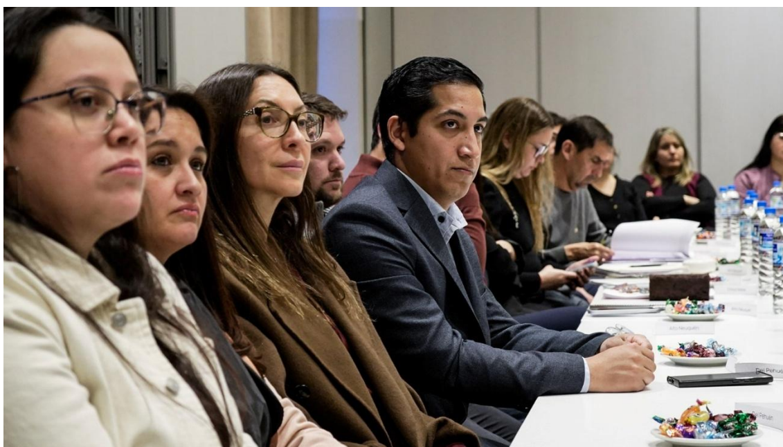
Representantes de Región Alto Neuquén en la 2° Jornada de Trabajo presencial 08 de agosto de 2025