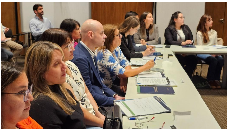
Representantes de Región de los Lagos del Sur en la 1ª Jornada de Trabajo presencial