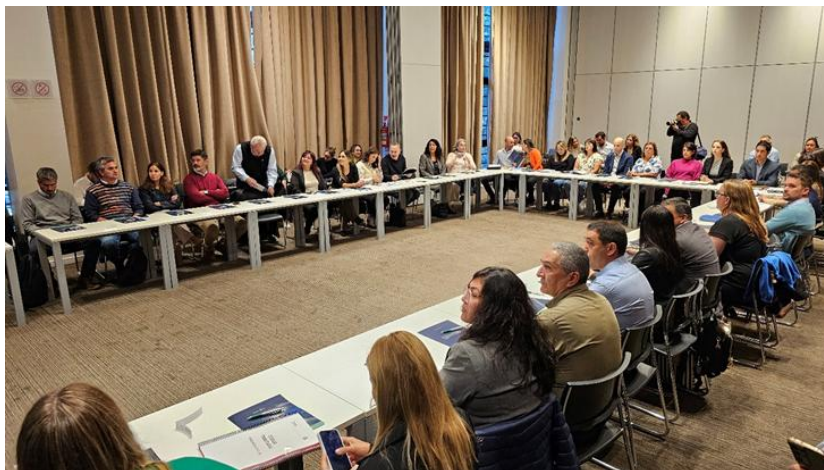
1º Jornada de Trabajo presencial 27 de marzo de 2025

La participación 20 municipios, distribuidos por región, garantizó que las necesidades específicas de cada zona fueran consideradas y consensuadas: