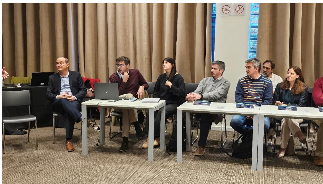
Equipo de Ingresos Públicos y Rentas en la 1º Jornada de Trabajo presencial 27 de marzo de 2025