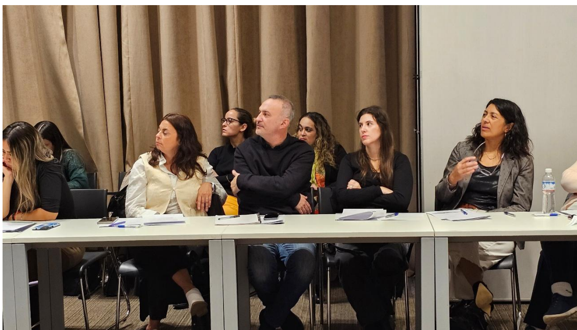
Representantes de la Región Confluencia en la 1° Jornada de Trabajo presencial